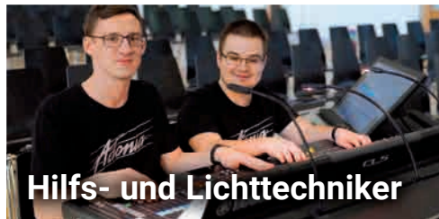
Hilfs- und Lichttechniker

«Das wohl beste Camperlebnis für meine Kinder!»