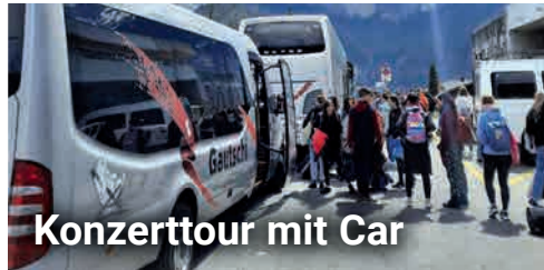
Konzerttour mit Car